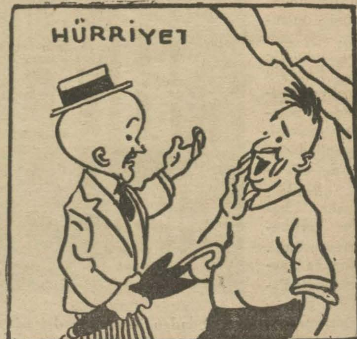
4: Hasan B. — Sen bu dağa bir balta vurursan tepene yıkılır ve seni sevgiline değil, öteki dünyaya kavuşturur.