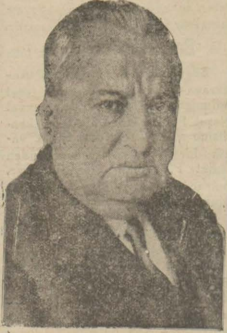
Yunus Nadi Bey