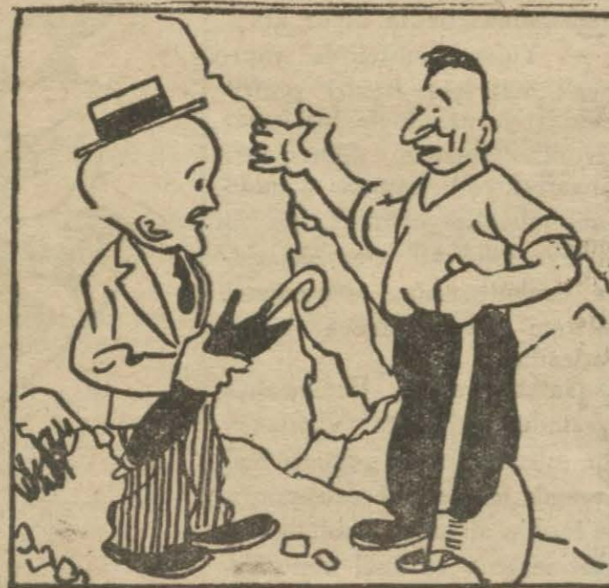
2: Hükümet muharriri — Hasan B. şurada bir dağ var. Onu devirsem sevgilime kavuşacağım.