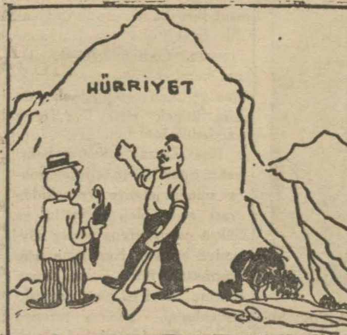
3: Hükümet muharriri — Bak işte şu dağ... İsmi "Hürriyet," dağ!