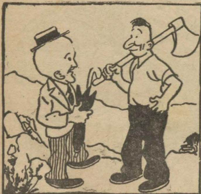
1: Hasan Bey — Pazar ola gazeteci başı... Elindeki o balta nedir?