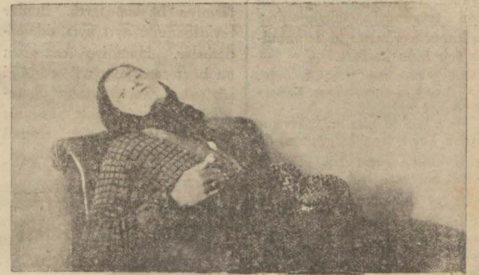
Cigeri hasta bir genç kadın, dispanserde dinleniyor